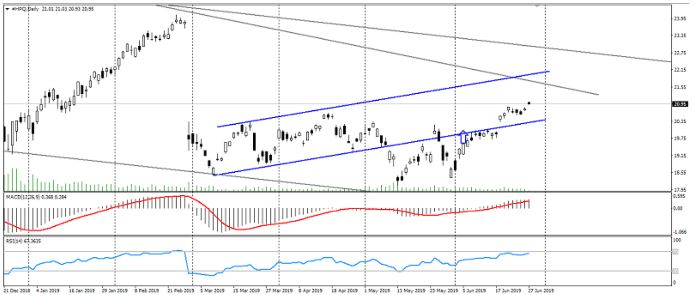
График акций Hewlett-Packard