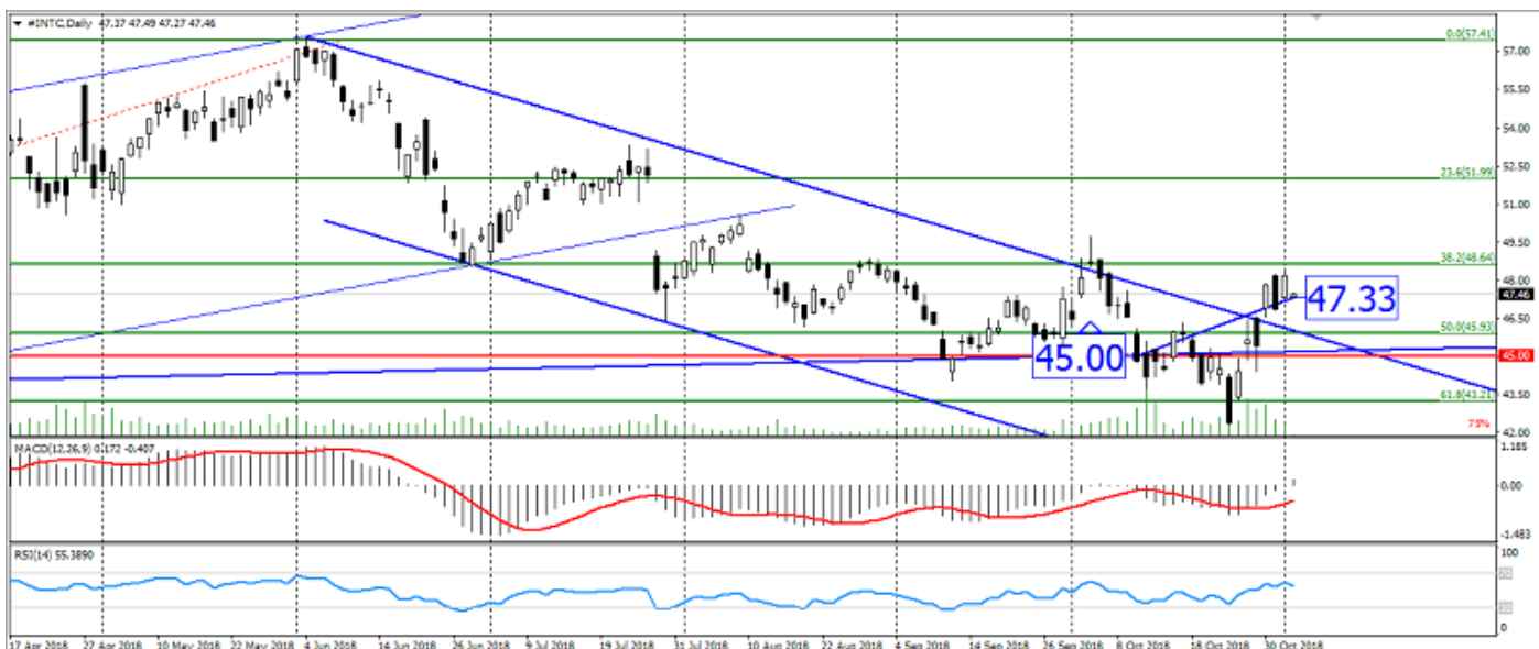
Графік акцій Intel

Акції Intel продемонстрували зростання на розвороті, як і очікувалося. Але подальше зростання даних акцій, ймовірно, буде обмежене корекцією.