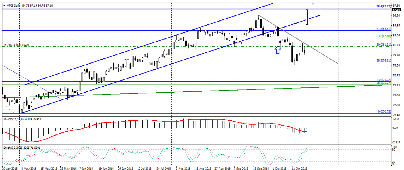
График акций PG. Текущая цена – 87.10.

Это вызвало стремительный рост акций данной компании, который тем самым полностью оправдал ожидания данной инвестиционной идеи.