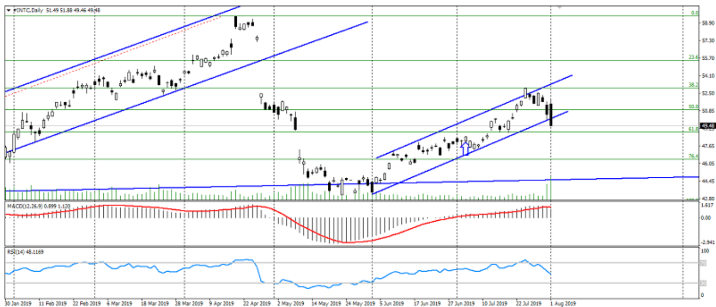
График акций Intel

Инвестиционная идея «Заработай на росте акций компании Intel» закрывается с достижением первой консервативной цели и на обострении рисков. Фактическая прибыль по данной идее варьируется от 150 до 250 пунктов.