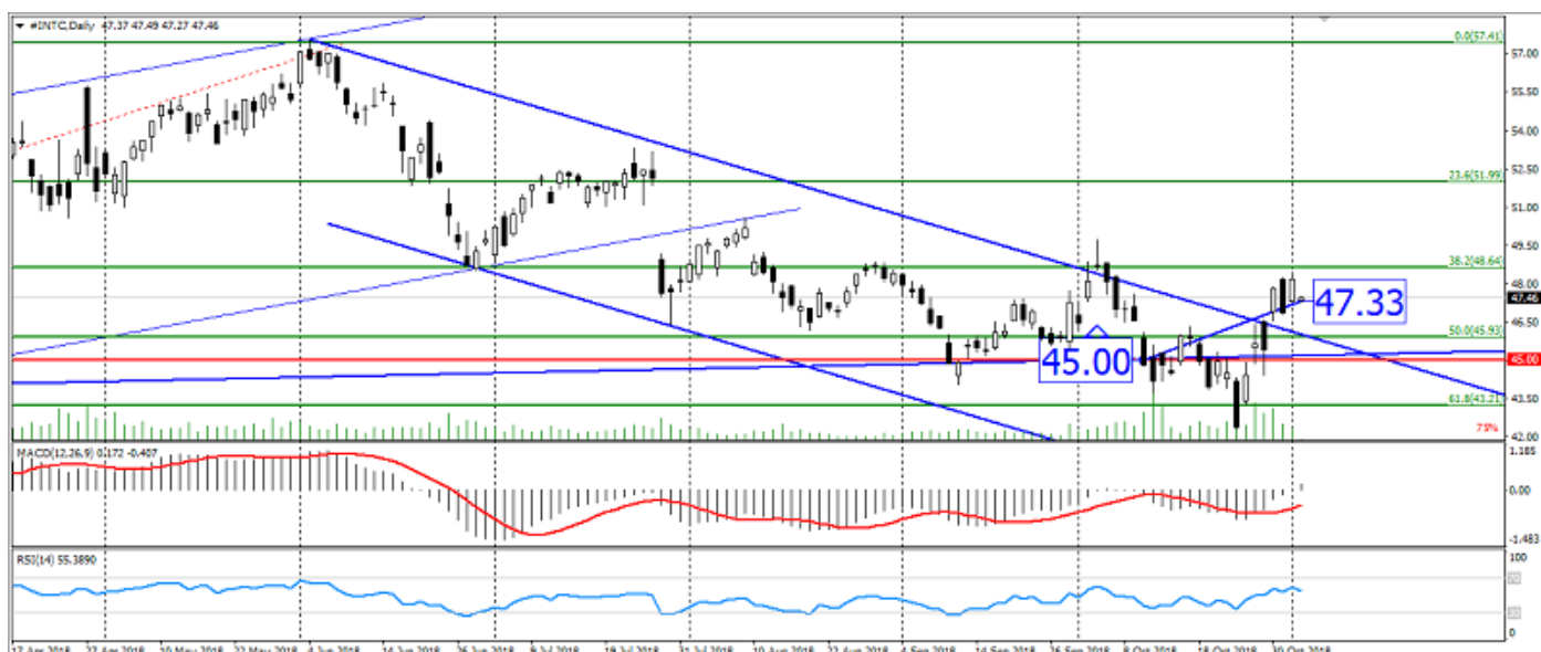
График акций Intel

Акции Intel продемонстрировали рост на развороте, как и ожидалось. Но дальнейший рост данных акций, вероятно, будет ограничен коррекцией.