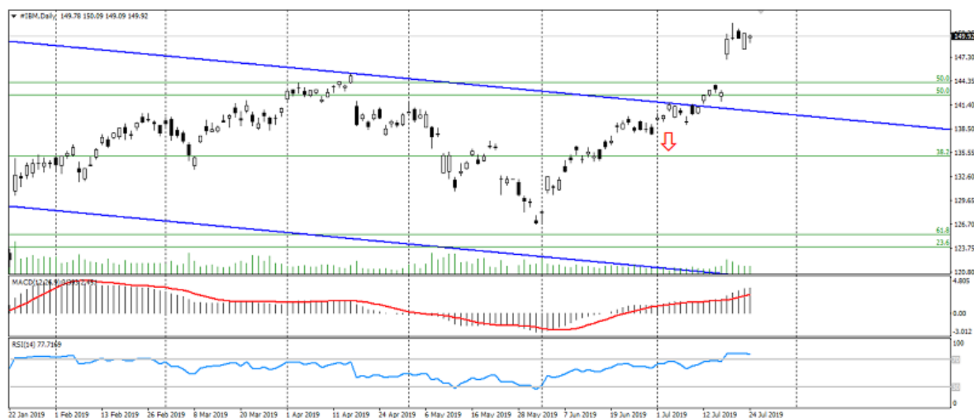
График акций IBM

Но этого оказалось достаточно для роста акций IBM и преломления нисходящего тренда. В результате чего данная инвестиционная идея не получила старт к отработке и закрывается, поскольку не были выполнены условия старта и смены картины рынка.