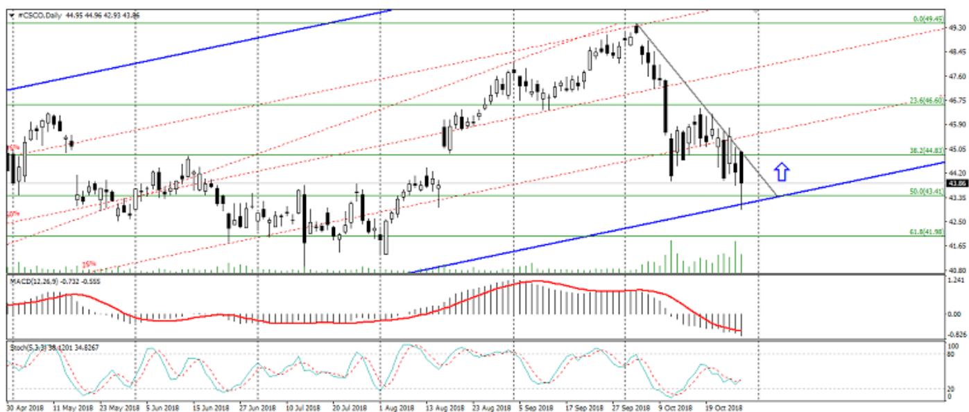
Рис. 2. График акций Cisco Systems.

3. Технический фактор. Технически акции Cisco Systems ограничиваются нисходящим коррекционным движением, который, в свою очередь, отвечает общему восходящему тренду. В сложившейся ситуации дальнейшее снижение акций Cisco Systems ограничивается нижней границей восходящего канала и перепроданностью данного актива.