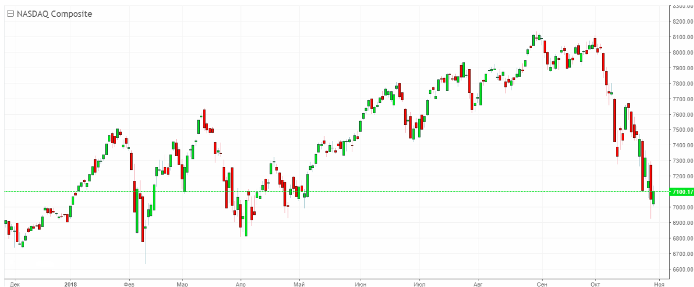
Рис. 3. График индекса NASDAQ.