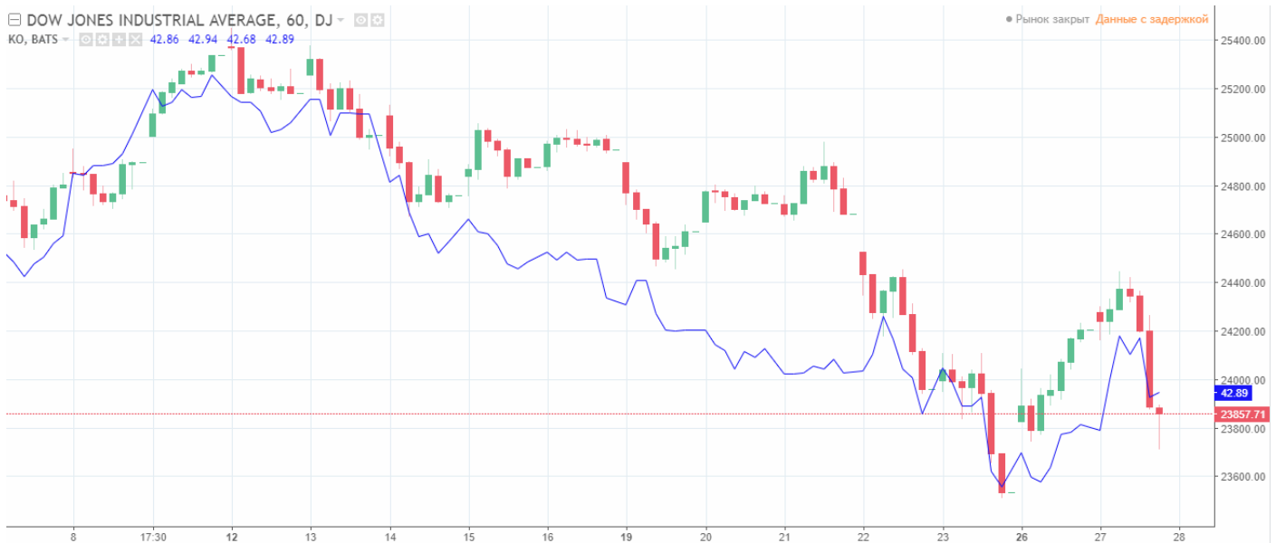
Рис. 1. Динаміка індексу DOW 30 і акцій компанії Coca-Cola (синя лінія)

Акції компанії Coca-Cola входять в розрахунок безлічі біржових індексів: DOW 30, S & P 500, STOXXGlobal 150 USD Price і багатьох інших, що підтверджує значущість даної компанії.