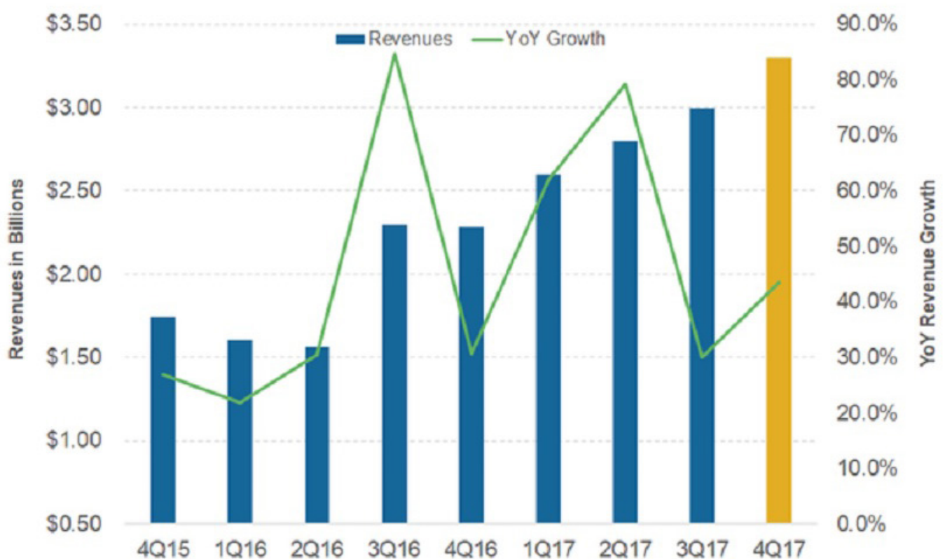
Tesla's Revenues and 4Q17 Estimates

В першу чергу давайте розберемо ряд фінансових показників компанії за останні роки.