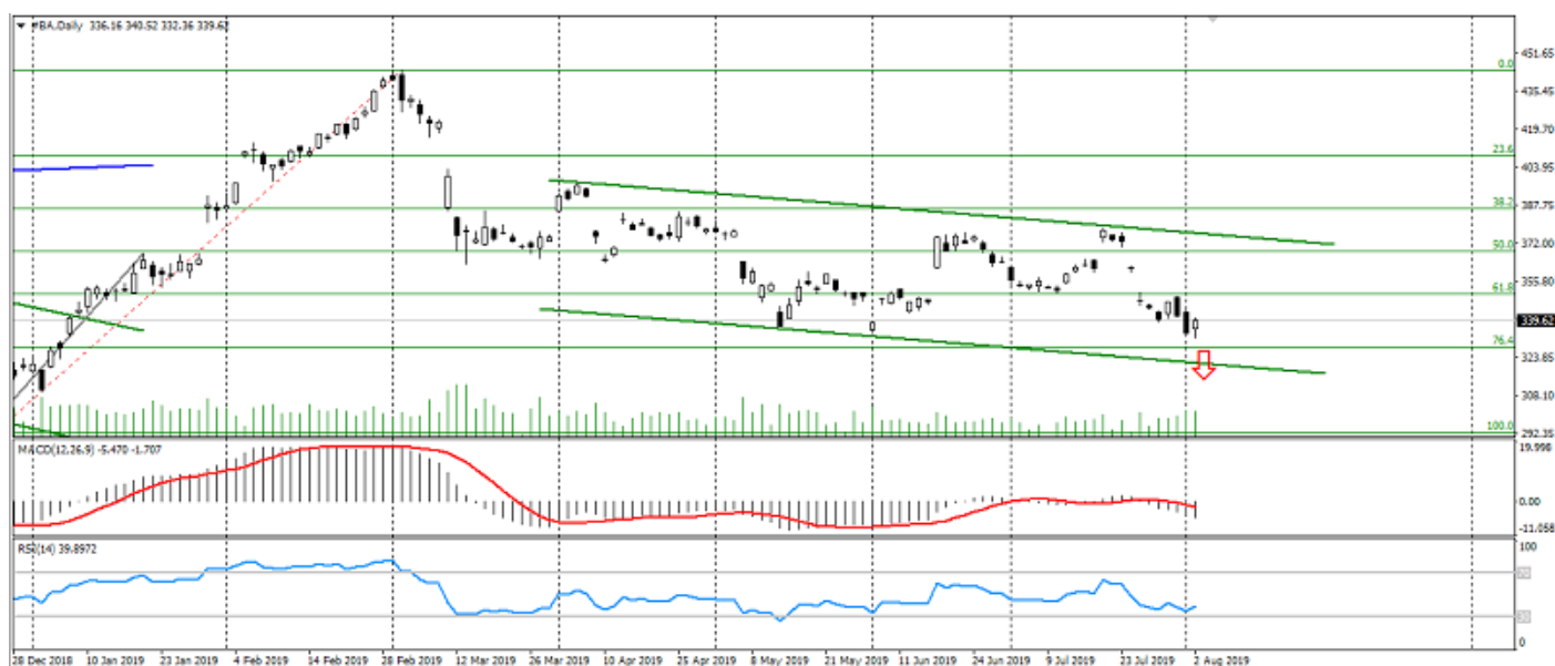
Рис. 2. График акций The Boeing Company

3. Технические факторы. Технически акции Boeing остаются под давлением, формируя устойчивый нисходящий канал.