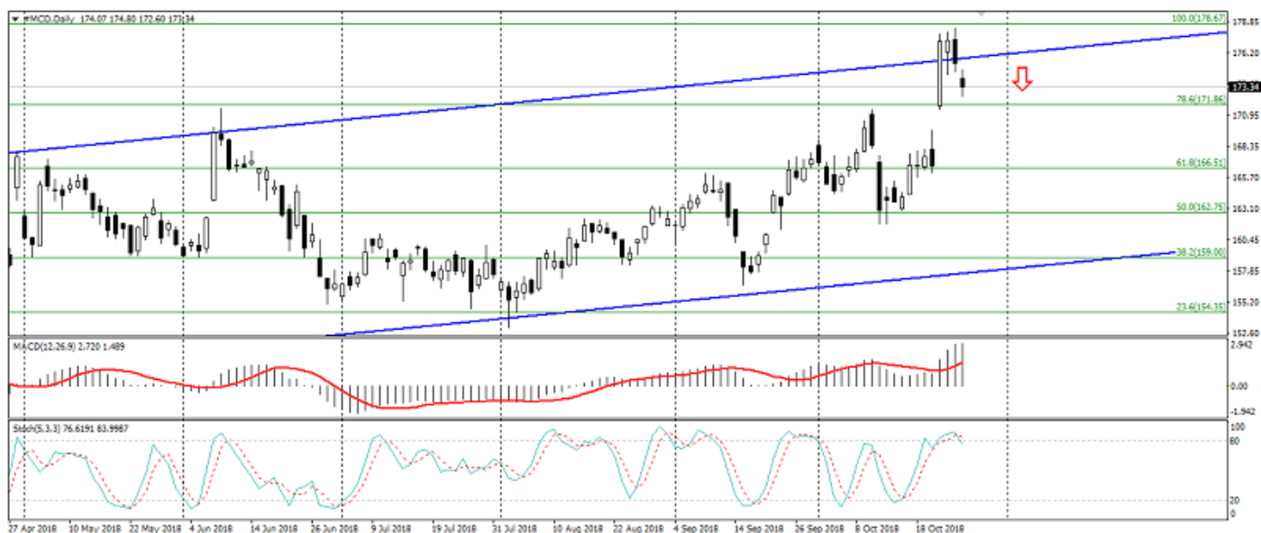
Рис. 3. График акций MCD.

Акции McDonalds ограничиваются перекупленностью и верхней границей торгового канала.