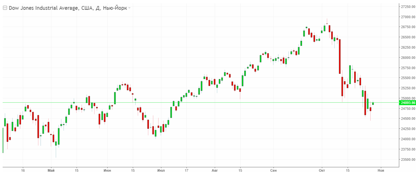
Рис. 2. График индекса DOW 30.

На фоне нисходящих настроений фондовых рынков акции McDonalds также выглядят весьма переоценёнными, особенно учитывая месячное снижение индекса DOW 30.