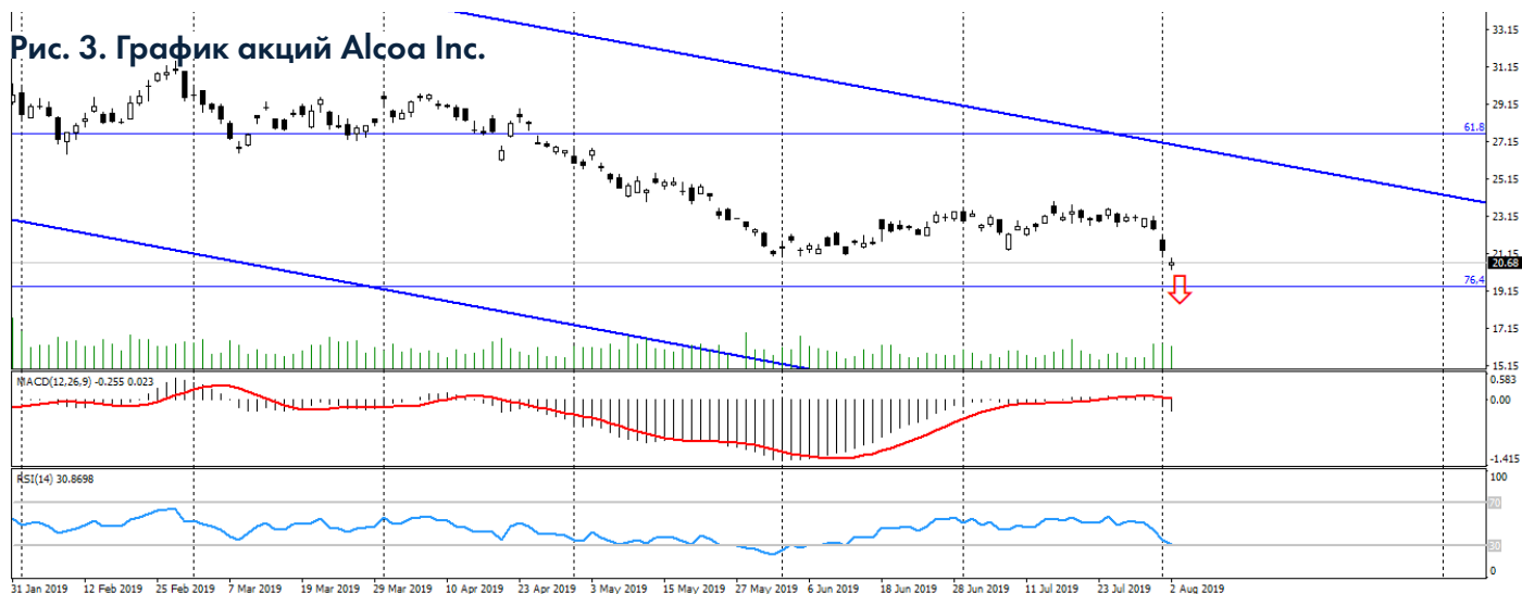
Рис. 3. График акций Alcoa Inc.

3. Технические факторы. Технически акции Alcoa Inc. находятся возле годового минимума, сохраняя общий двухлетний нисходящий тренд. Ограничивающим фактором вступает перепроданность данных акций, которая образовалась на нескольких последних торговых днях. Фактически в июне и июле данные акции торговались во флэте, чем разгрузили общую перепроданность данного актива.