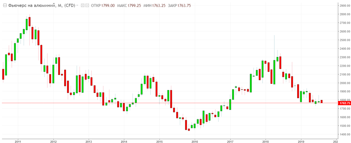
Рис. 1. График фьючерса на алюминий

На графике прослеживается устойчивая нисходящая динамика фьючерса на алюминий. Это фактически указывает на сохранение нисходящей динамики данного актива в условиях обострения торговой войны и замедления мировой экономики.