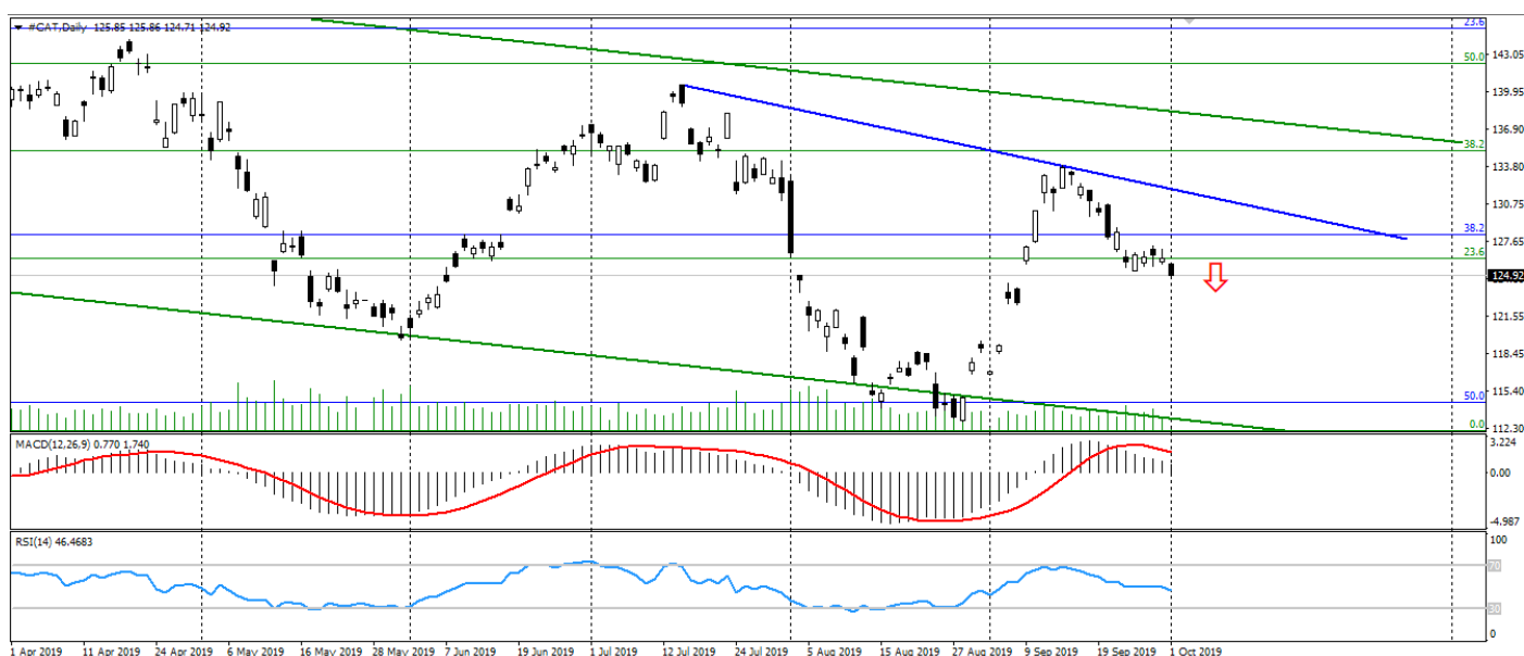
Рис. 2. График акций Caterpillar Inc.

В условиях торговой и экономической неопределённости, продажи акций Caterpillar выглядят весьма перспективно, особенно после формирования очередного нисходящего разворота.