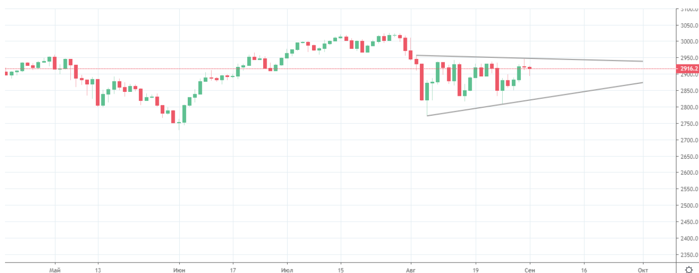
Рис. 1. График индекса S&P 500

Индекс S&P 500, самый объемный индекс США, и динамика акций Citigroup Inc. остаются весьма сдержанными, формируя месячный флэт. Что на фоне роста оптимизма можно расценивать как потенциал к росту.