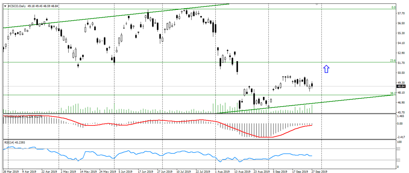
Рис. 3. График акций Cisco Systems.

4. Технические факторы. Технически акции Cisco Systems после снижения в августе формируют восходящий разворот на отбитии от нижней границы восходящего канала и зоны поддержки 46.50-46.00. Также стоит отметить уровень 48.00-50, отбитие от которого укажет на возобновление роста.