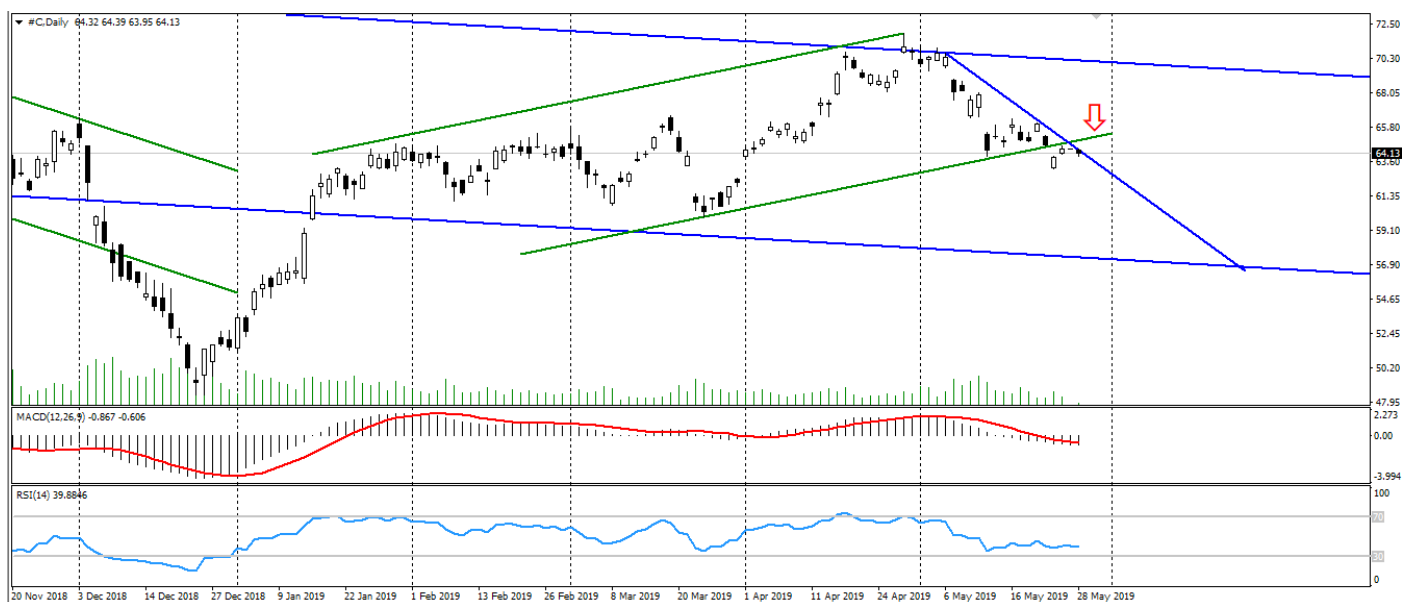
Рис. 2. График акций Citigroup

3. Техническая картина. Технически акции Citigroup продолжают торговаться в двухлетнем нисходящем канале. Так, после коррекционного восходящего движения, акции готовы возобновить общий нисходящий тренд. Стоит отметить, что в условиях сохранения рисков, возобновления снижения акций Citigroup может быть более значительным, чем устоявшийся торговый канал.