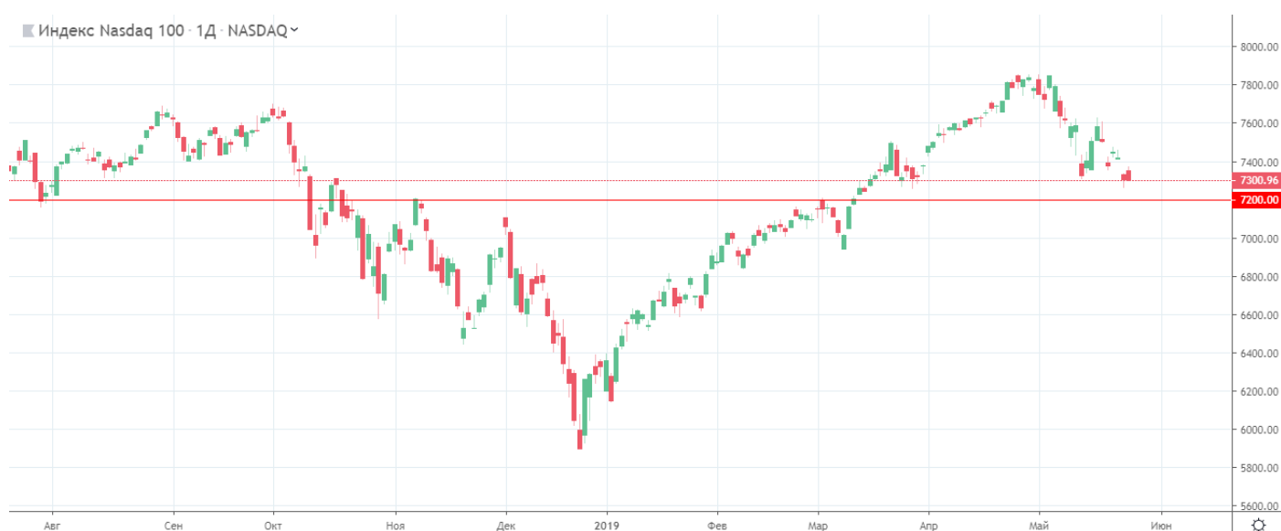
Рис. 1. График NASDAQ 100

Технологическим фондовым индексом выступает NASDAQ 100, который отображает общую динамику высоко технологических компаний, в полной степени отобразил все торговые риски.