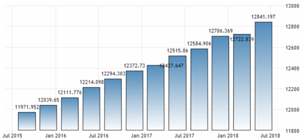
Рис. 2. График потребительских расходов США

2. Рост потребительских расходов. The Procter & Gamble Company – мировой лидер потребительских товаров. И это напрямую указывает на то, что с увеличением потребительских расходов компания продолжит наращивать объём продукции и прибыли. Чего стоит только рост потребления в США, еврозоне и Китае.