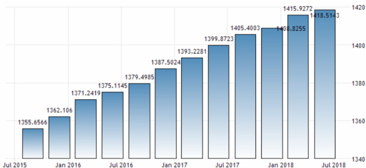
Рис. 3. График потребительских расходов еврозоны