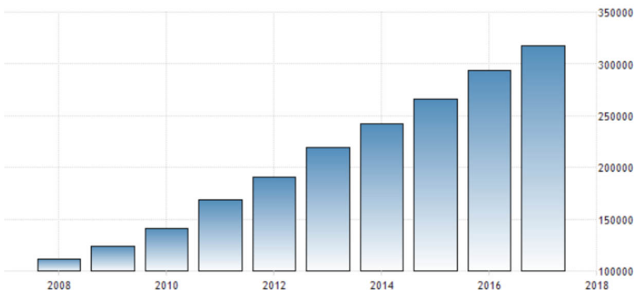
Рис. 4. График потребительских расходов Китая

Все показатели объединяет устойчивый восходящий тренд, подтверждающий рост потребительских расходов.