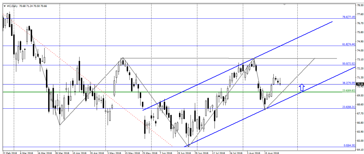
Рис. 3. График акций Citigroup Inc.

Акции Citigroup Inc. остаются в трёхмесячном восходящем тренде и формируют разворотную модель «перевёрнутая голова и плечи».