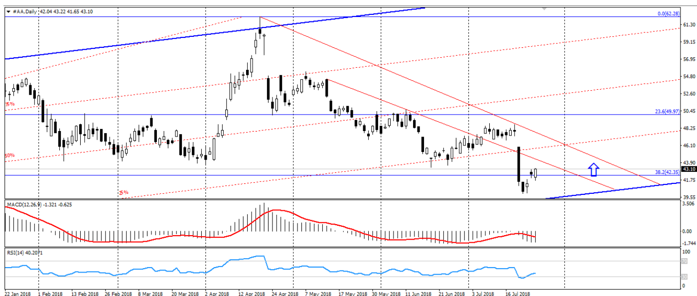
Рис. 4. График акций Alcoa Inc. D1

3. Технические факторы. Акции Alcoa Inc., начиная с 2016 года, торгуются в восходящем тренде. Со середины апреля текущего года данные акции остаются в фазе коррекции, чему способствовала динамика алюминия. При этом медвежья дивергенция на W1 полностью себя отработала. А зона 39.50-41.00 выступает нижней границей общего восходящего тренда, от которой и стоит рассматривать сделки на покупку.