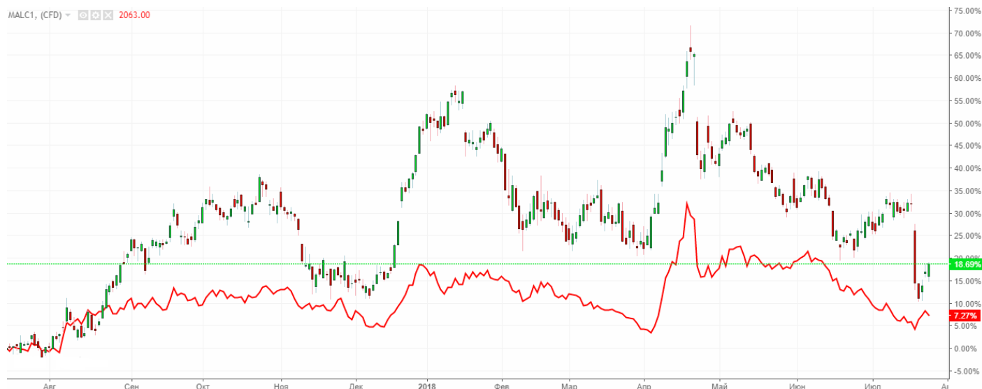
Рис. 3. График динамики акция Alcoa Inc. и фьючерсов на алюминий (красная линия)

Динамика акций Alcoa Inc. является связанной с динамикой алюминия и имеет прямую корреляцию. Поэтому рост стоимости алюминия также позитивно скажется на акциях Alcoa Inc. В то же время дефицит алюминия на 2018 год ожидается в 1-1,5 млн. тонн, а ожидаемый рост спроса на алюминий в текущем году составляет порядка 4-5%.