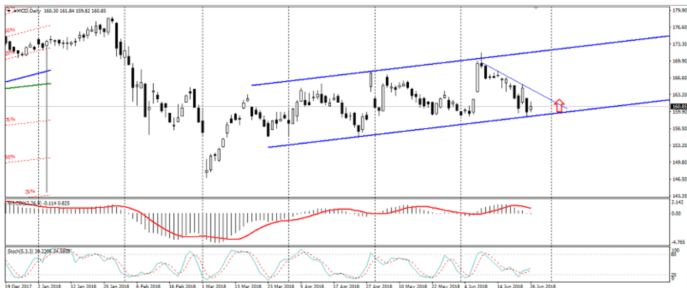
Рис. 3. График акций MCD.