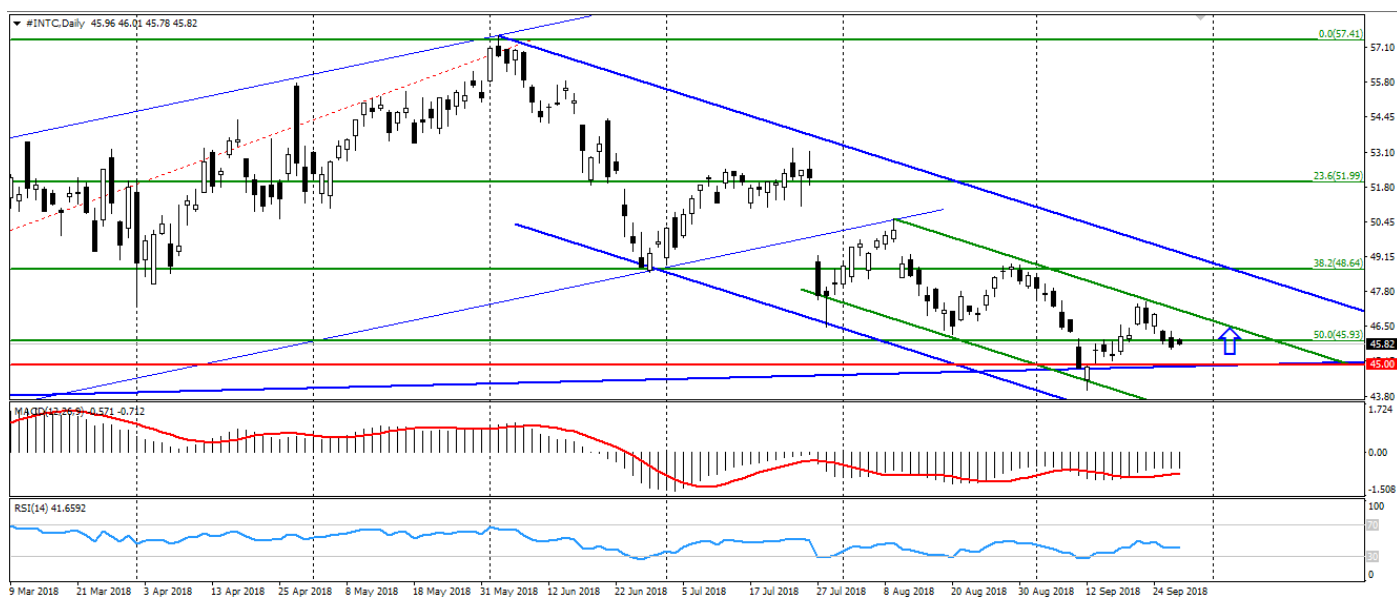
Рис. 3. График акций Intel

Акции Intel ограничиваются психологией 45.00, от которой вероятно отбитие.