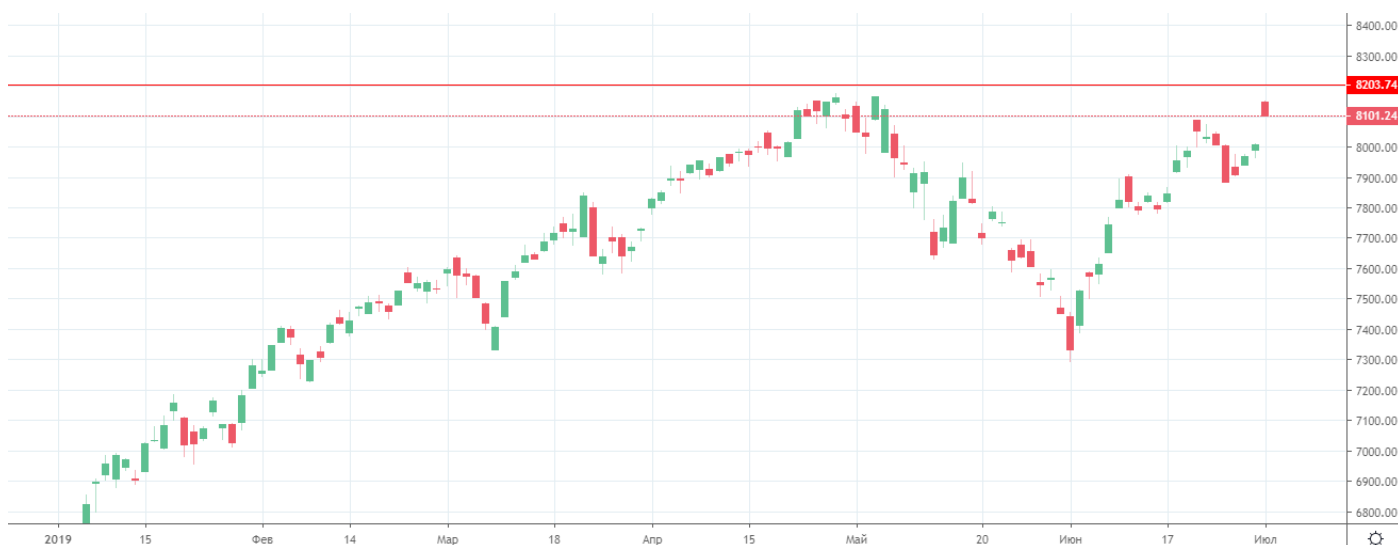
Рис. 1. График индекса NASDAQ

На фоне снижения рисков ожидается рост оптимизма на рынке и как результат укрепление фондовых индексов. Таким индексом выступает индекс NASDAQ, который продолжает ограничиваться историческим максимумом на уровне 8200.00.