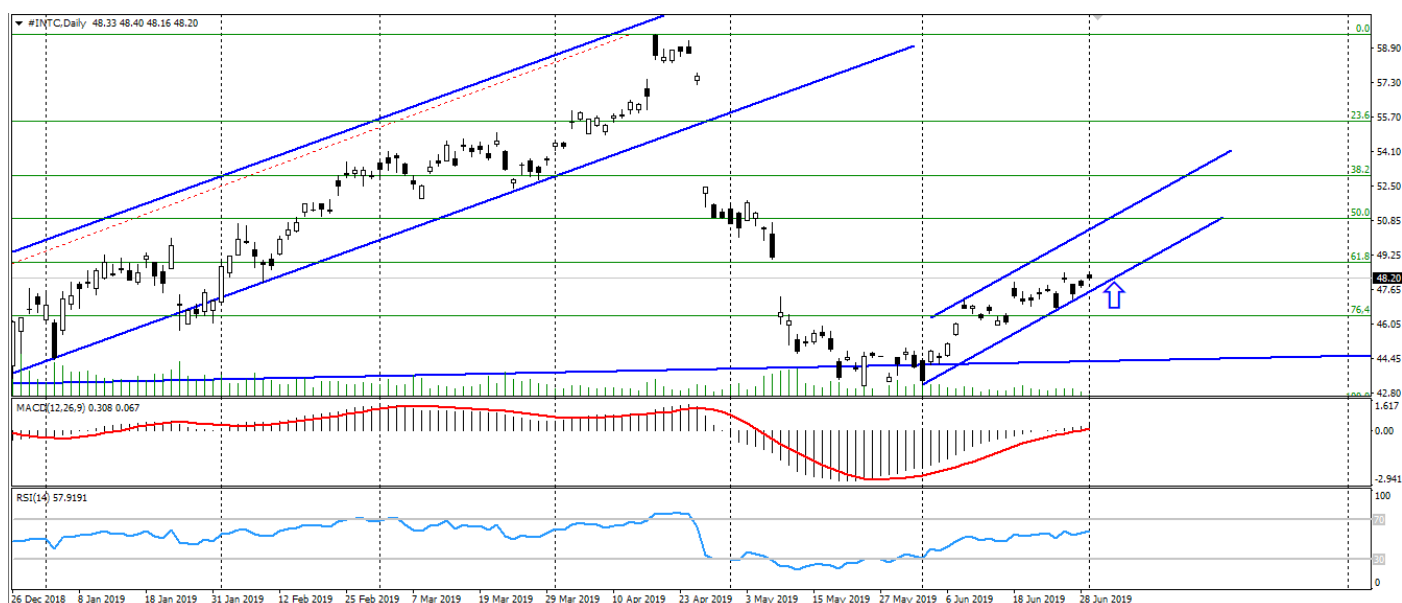
Рис. 3. График акций Intel

3. Технические факторы. Технически акции Intel сохраняют восходящую динамику на отбитии от уровня 43.50. При этом сдержанное замедление роста данных акций в конце июня разгрузило перекупленность актива. Также стоит отметить продолжение закрытие гэпа мая.