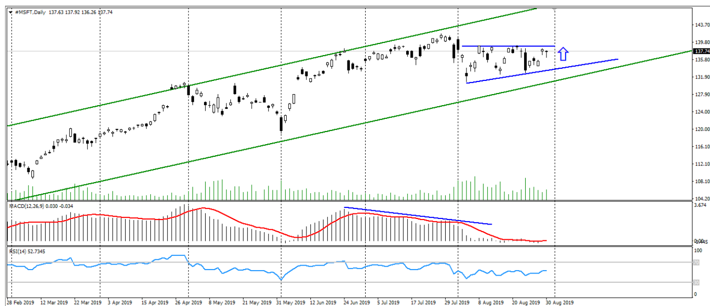
Рис. 3. График акций Microsoft Corporation

3. Технические факторы. Технически акции Microsoft Corporation весь август торговались во флэте, формируя восходящий клин. Что можно расценивать как откат нисходящей дивергенции июня и июля; и техническим сигналом к возобновлению роста.