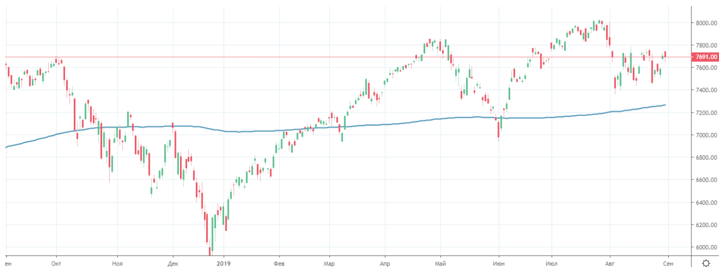
Рис. 2. График индекса NASDAQ

Восходящая динамика индекса NASDAQ также указывает на потенциал роста данных акций и данного сегмента рынка.