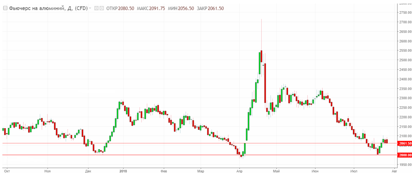
Мал. 2. Графік ф'ючерсу на алюміній

2. Зростання вартості алюмінію. Основним фундаментальним фактором зміцнення акцій Alcoa Inc. залишається висхідна динаміка ф'ючерсів на алюміній, який торгується в висхідному тренді з початку 2016 року і обмежується в зниженні психологічним рівнем 2000.00.