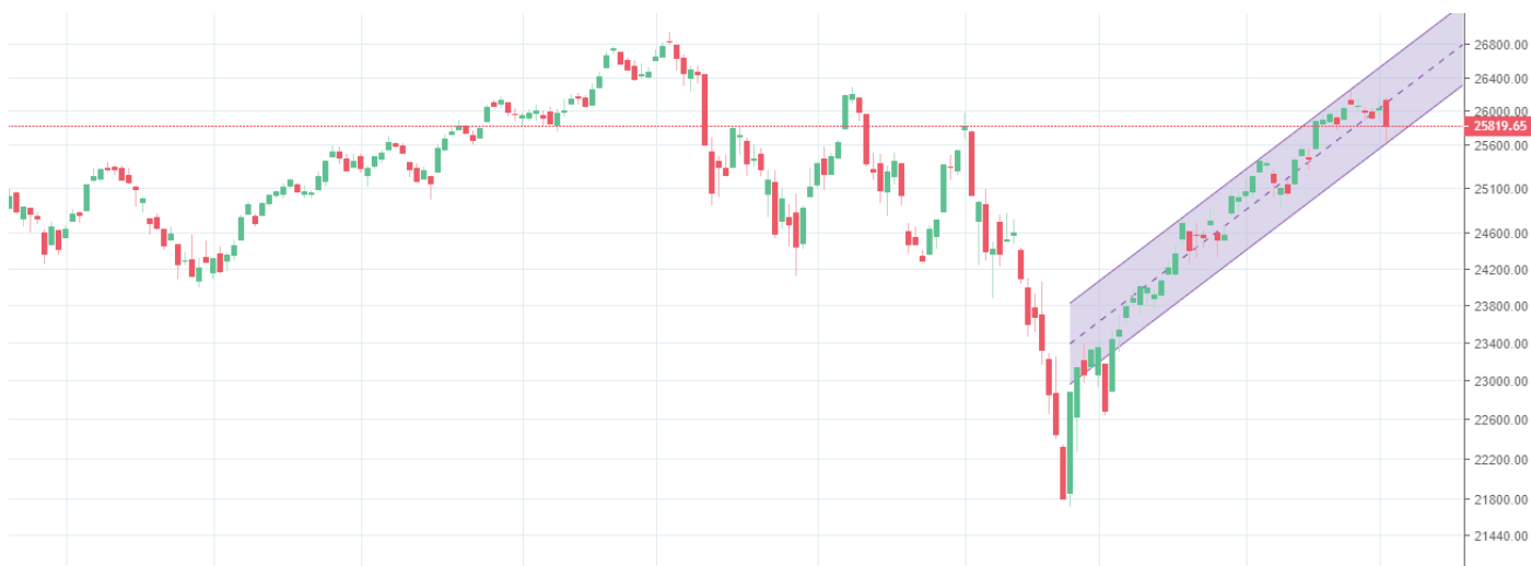
Рис. 3. График индекса DOW 30

График индекса DOW 30 сохраняет восходящую динамику, ограничиваясь незначительной коррекцией на разгрузке перекупленности.