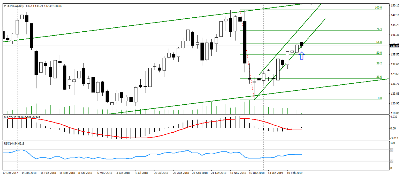
Рис. 1. График акций Johnson & Johnson

В результате снижения акции JNJ оказались перепроданными и недооценёнными. Это является отличным поводом для инвестиций в данный недооценённый актив.