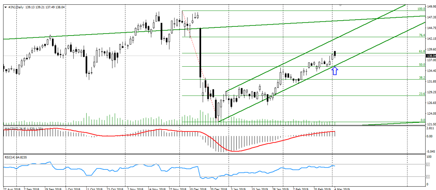
Рис. 4. График акций Johnson & Johnson

4. Технические факторы. Технически акции Johnson & Johnson торгуются в устойчивом восходящем канале, фактически восстанавливаясь после снижения. Ограничивающим фактором роста акций JNJ может выступать перекупленность, которая может вызвать снижение в пределах существующего канала.