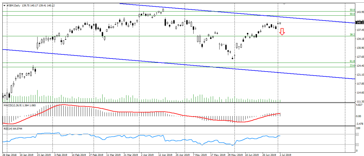
Рис. 2. График акций IBM

Акции IBM с начала 2017 сохраняют нисходящий торговый канал, который дает весомые аргументы к возобновлению снижения акций IBM.