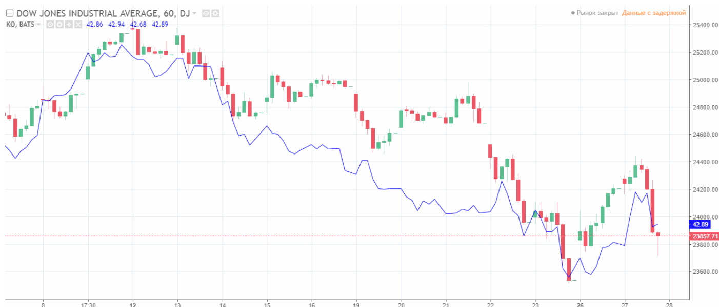
Рис. 1. Динамика индекса DOW 30 и акций компании Coca-Cola (синяя линия)

имеет тиккер КО. Акции компании Coca-Cola входят в расчёт множества биржевых индексов: DOW 30, S&P 500, STOXXGlobal 150 USD Price и многих других, что подтверждает значимость данной компании.