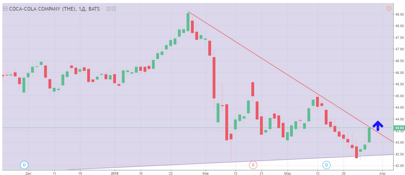
Рис. 4. График акций Coca-Cola. Текущая цена – 43.60.

Основным фактором риска остается нисходящая динамика фондовых площадок США на политических рисках. При этом восстановление фондовых площадок США окажет акциям Coca-Cola поддержку в укреплении.