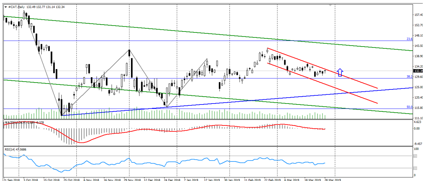
Рис. 3. График акций Caterpillar Inc.

Фактором риска остаются торговые отношения США и Китая, обострение которых, несмотря на низкую вероятность, негативно скажутся не только на акциях компании Caterpillar Inc., но и на всем фондовом рынке.