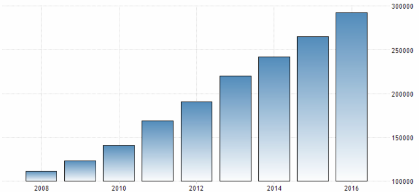
Рис. 3.: Споживчі витрати ЄС.