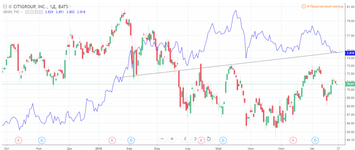
Мал. 2. Графік акцій Citigroup Inc. і 10-ти літніх держ. облігацій США

Також не варто забувати про прибутковість держ. облігацій США, з якими акції Сітігруп Інс. мають неабияку пряму кореляцію. Держ. облігації, в свою чергу, залишаються біля місячних мінімумів.