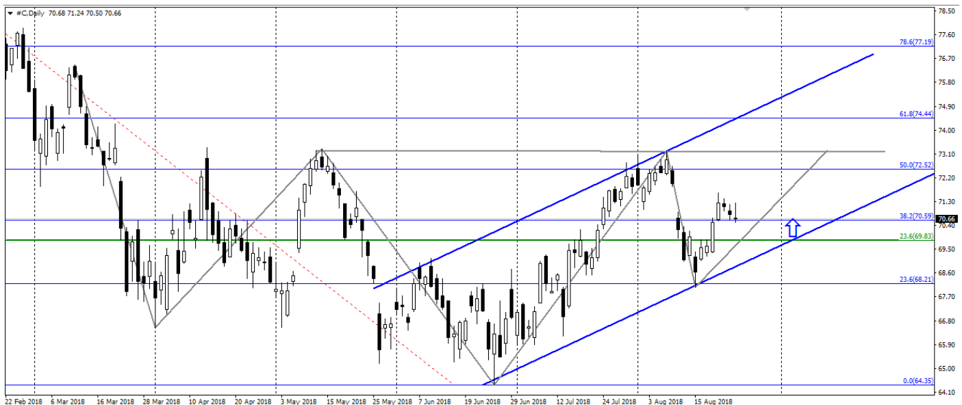
Мал. 3. Графік акцій Citigroup Inc.

Акції Citigroup Inc. залишаються в тримісячному висхідному тренді і формують розворотну модель «перевернута голова і плечі».