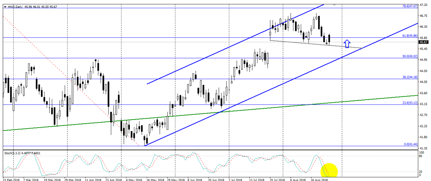
Мал. 2. Графік акцій Соса-Кола Company

3. Технічні фактори. Починаючи з травня поточного року, акції Соса-Кола торгуються в стійкому висхідному тренді, тим самим корегуючись після зниження на початку року. Варто підкреслити, що з закріпленням акцій даної компанії вище позначки 45.00 (61.8 рівні Фібоначчі від максимумів поточного року до мінімумів), збережеться висхідна динаміка і потенціал до зміцнення.