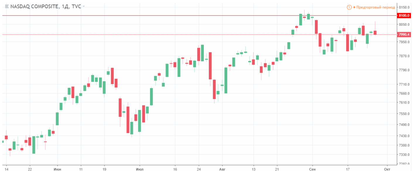
Мал. 2. Графік індексу NASDAQ

2. Очікування зростання сегмента ІТ. Починаючи з осені, сектор ІТ технологій, зокрема мікроконтролерів, виходить з літньої сплячки, в яку впадає сезонно. Також з ростом активності в даному сегменті ринку варто було очікувати і збільшення в споживанні продукції Intel. Фактором, що вказує на зростання даного сектору, окрім сезонності, також виступає і тривалий рух індексу NASDAQ у флеті, який, в свою чергу, зберігає висхідний тренд, але обмежується максимумом серпня на рівні 8100.00.